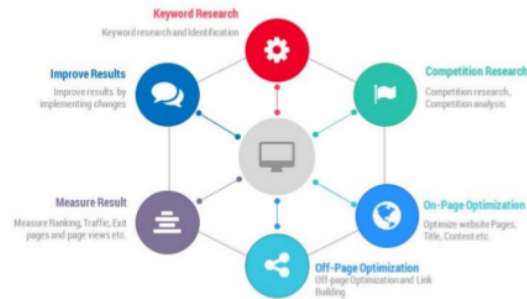
Gambar. 1. Tahap SEO [5]

Menurut dari gambar 1 tahap SEO ada 5 yaitu Keyword Research , On-page Optimization , Off-page Optimization , Measure Result dan Improve Results biasa dikenal oleh praktisi SEO sebagai Monitoring/Measurement Analysis dan Competition Research . Sebelum masuk kepada tahap utama strategi SEO, satu tahap yang dianggap optional oleh kebanyakan praktisi SEO yaitu Competition Research . Untuk tahap utama dalam strategi SEO terdapat 4 yaitu Keyword Research , On-page Optimization , Off-page Optimization dan Monitoring/Measurement Analysis .