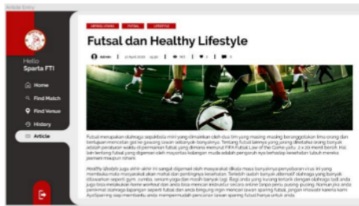
Gambar. 3. Isi dari artikel pada halaman artikel AyoSparring

Pada gambar 2 dapat dilihat bahwa halaman artikel dapat diisi oleh admin, tim futsal yang sudah mendaftar di website AyoSparring dan penulis artikel lepas dengan topik-topik yang relevan dengan olahraga futsal. Kemudian di dalam artikel nya juga akan di optimasikan menggunakan kata kunci tentang futsal sebagai kata kunci utama dan sparing futsal sebagai kata kunci pendukung sesuai dengan pemilihan dari tahap Keyword Research . Halaman artikel ini dimaksudkan untuk memenuhi tahap On-page Optimization yaitu mengisi website dengan konten-konten yang organik dan bukan spam.