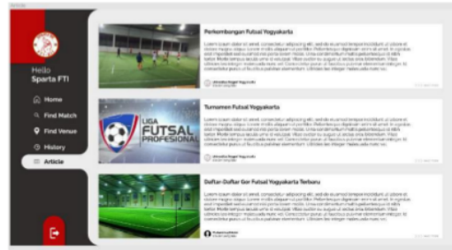
Gambar. 2. Rancangan antarmuka halaman artikel AyoSparring

AyoSparring juga memiliki halaman khusus untuk artikel mengenai futsal untuk mengoptimalkan On-page Optimization . Seperti yang ditunjukkan pada tabel 2 didapatkan 6 kata kunci yaitu artikel futsal memiliki volume 110 dan SEO Difficulty 19, artikel tentang futsal memiliki volume 70 dan SEO Difficulty 13, artikel olahraga futsal memiliki volume 70 dan SEO Difficulty 14, fakta tentang futsal memiliki volume 10 dan SEO Difficulty 13, tentang futsal memiliki volume 170 dan SEO Difficulty 18 dan materi tentang futsal memiliki volume 170 dan SEO Difficulty 14. Selanjutnya dipilih 3 kata kunci memiliki volume terbesar yaitu tentang futsal dengan 170, materi tentang futsal dengan 170 dan artikel futsal dengan 110. Selanjutnya dari segi SEO Difficulty yaitu tentang futsal dengan 18, materi tentang futsal dengan 14 dan artikel futsal dengan 19. Untuk Informational Keyword lebih baik memiliki jumlah kata yang sedikit jadi dipilih artikel futsal dan tentang futsal. Perbandingan volume dan SEO Difficulty antara artikel futsal yang memiliki 110 dan 19 sedangkan tentang futsal 170 dan 18 dipilih kata kunci tentang futsal. Setelah memilih kata kunci tentang futsal, maka kata kunci akan disisipkan pada beberapa artikel website AyoSparring yang nanti nya akan membantu perebutan peringkat teratas pada kata kunci tentang futsal.