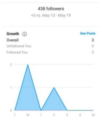
Gambar 4.5 Rincian perkembangan jumlah pengikut media sosial Instagram Komunitas Kantong Pintar

Menurut data di atas, terdapat peningkatan engagement dan jumlah pengikut akun media sosial Komunitas Kantong Pintar dalam jangka waktu satu minggu, walaupun angkanya masih terhitung sedikit. Hal ini menunjukkan bahwa dengan adanya penjadwalan unggahan yang konstan dan tepat sasaran memungkinkan peningkatan jumlah engagement pengikut media sosial semakin bertambah.