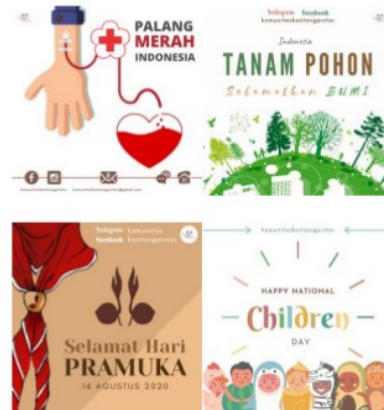
Gambar 4.9 desain yang sedang diuji coba dan dinilai

Beberapa contoh draft desain unggahan juga sedang diuji coba dan dinilai oleh anggota Komunitas Kantong Pintar dalam bentuk kuisioner google form tanggal 6 Juni sampai tanggal 10 Juni 2020.