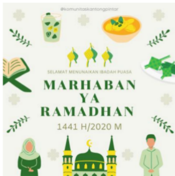
Gambar 4.1 Desain unggahan media sosial dalam rangka memasuki bulan Ramadhan 1441 H

Hasil dari pengabdian ini adalah berupa jadwal dan desain unggahan Instagram Komunitas Kantong Pintar. Salah satu desain yang telah dibuat adalah unggahan untuk memperingati bulan Ramadhan 1441 H, yang diunggah pada tanggal 25 April 2020.