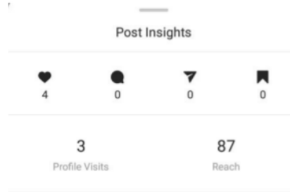
Gambar 4.3 rincian engagement langsung pengikut terhadap unggahan

Berdasarkan gambar di atas, dapat dijelaskan bahwa unggahan tersebut telah dilihat oleh 99 pengguna, dengan rincian 82 pengguna melihat melalui laman utama akun Instagram mereka, 12 pengguna melihat dengan membuka profil Instagram Komunitas Kantong Pintar, dan 5 pengguna melalui bagi pesan sesama pengguna. Diantara 99 pengguna, 9% adalah pengguna yang tidak mengikuti Instagram Komunitas Kantong Pintar.