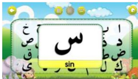
Gambar 4. Tampilan materi belajar

Pada menu belajar (Gambar 3), terdapat 3 sub menu materi belajar, yaitu pengenalan hijaiyah, penenalan harakat dan baca iqro'. Apabila pengguna memilih menu hijaiyah, maka nantinya program akan menampilkan materi hijaiyah, seperti yang tertera di gambar (Gambar 4). Materi yang ditampilkan berupa gambar, suara, dan animasi, sehingga memudahkan pengguna untuk dapat menangkap materi pembelajaran.