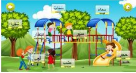
Gambar 6. Tampilan menu bahasa arab

Pada menu bahasa arab (Gambar 5), terdapat 3 sub menu tema bahasa arab, yaitu lingkungan, profesi dan sekolah. Tampilan program pada tema lingkungan (Gambar 6) menggambarkan tentang suasana dilingkungan, mulai dari pemandangan, pohon-pohon, kegiatan yang sering dilakukan dan juga aktivitas-aktivitas lain. Tampilan ini didukung dengan tulisan bahasa arab yang dapat menunjang peserta didik untuk mengenal lebih dekat bahasa arab.