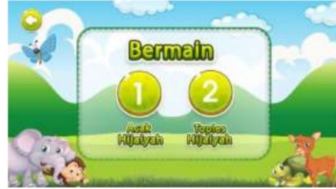
Gambar 9. Tampilan menu bermain

Pada menu bernanyi (Gambar 7), terdapat 10 kategori lagu anak-anak bernuansa islami, lagu yang dipilih nantinya akan menampilkan suara dan juga video dari lagu tersebut, seperti dalam gambar di atas (Gambar 8). Kategori lagu anak-anak yang muncul pada menu bernanyi, pada awalnya hanya terbuka 3 macam lagu, untuk dapat membuka lagu-lagu yang lain, pengguna harus menyelesaikan membaca iqro' terlebih dahulu di menu belajar (Gambar 3). pada tampilan itu akan menunjukkan judul lagu yang diputar yaitu lagu bismillah, beserta video untuk menunjang anak didik lebih termotivasi dalam mengikuti pembelajaran.