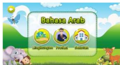
Gambar 5. Tampilan menu bahasa arab

Tampilan utama dalam program ini mengusung tema islami dengan gambar 2 karakter anak kecil serta adanya hewan-hewan sebagai tambahan untuk membuat tampilan utama program lebih berwarna