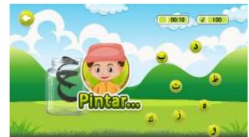
Gambar 11. Tampilan apabila berhasil memasukkan huruf hijaiyah

Pada menu bermain (Gambar 9), terdapat 2 sub menu permainan, yaitu acak hijaiyah, dan toples hijaiyah, dimana masing-masing dari pada permainan tersebut memiliki tingkatan level, seperti permainan toples hijaiyah (Gambar 10), dimana peserta didik diminta untuk memasukkan huruf-huruf hijaiyah yang sesuai dengan huruf yang terdapat di dalam toples hijaiyah. Huruf-huruf hijaiyah nantinya akan turun dari atas ke bawah dengan tempo sesuai dengan level permainan. Apabila berhasil, maka akan muncul pop up animasi yang memberitahu bahwa yang dimasukkan ke dalam toples hijaiyah adalah huruf yang sesuai (Gambar 11), setelah itu poin akan bertambah dan terus bertambah jika berhasil memasukkan huruf yang dimaksud, yang tertera disudut kanan atas level permainan.