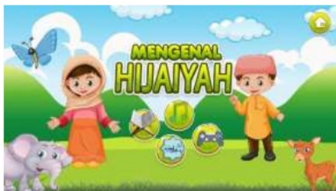
Gambar 2. Prototype tampilan utama program

Tampilan utama dalam program ini mengusung tema islami dengan gambar 2 karakter anak kecil serta adanya hewan-hewan sebagai tambahan untuk membuat tampilan utama program lebih berwarna