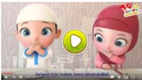
Gambar 8. Tampilan video dan lagu anak islami

Pada menu bernanyi (Gambar 7), terdapat 10 kategori lagu anak-anak bernuansa islami, lagu yang dipilih nantinya akan menampilkan suara dan juga video dari lagu tersebut, seperti dalam gambar di atas (Gambar 8). Kategori lagu anak-anak yang muncul pada menu bernanyi, pada awalnya hanya terbuka 3 macam lagu, untuk dapat membuka lagu-lagu yang lain, pengguna harus menyelesaikan membaca iqro' terlebih dahulu di menu belajar (Gambar 3). pada tampilan itu akan menunjukkan judul lagu yang diputar yaitu lagu bismillah, beserta video untuk menunjang anak didik lebih termotivasi dalam mengikuti pembelajaran.