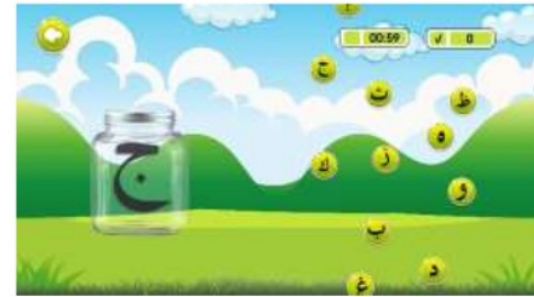
Gambar 10. Tampilan salah satu level permainan toples hijaiyah