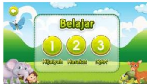
Gambar 3. Tampilan menu belajar

Pada tampilan ini (Gambar 2), terdapat 4 menu utama yang nantinya dapat dijalankan, yaitu menu belajar, menu bahasa arab, menu bernyanyi dan juga menu bermain, dimana menu-menu tersebut memiliki sub menu yang bisa dipilih sesuai keinginan. Menu tambahan lain yaitu, menu atau tombol setting, dimana pengguna bisa mengatur settingan dan juga informasi-informasi seputar program ini.