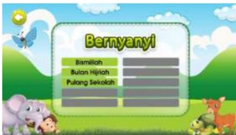
Gambar 7. Tampilan menu bernanyi

Pada menu bahasa arab (Gambar 5), terdapat 3 sub menu tema bahasa arab, yaitu lingkungan, profesi dan sekolah. Tampilan program pada tema lingkungan (Gambar 6) menggambarkan tentang suasana dilingkungan, mulai dari pemandangan, pohon-pohon, kegiatan yang sering dilakukan dan juga aktivitas-aktivitas lain. Tampilan ini didukung dengan tulisan bahasa arab yang dapat menunjang peserta didik untuk mengenal lebih dekat bahasa arab.