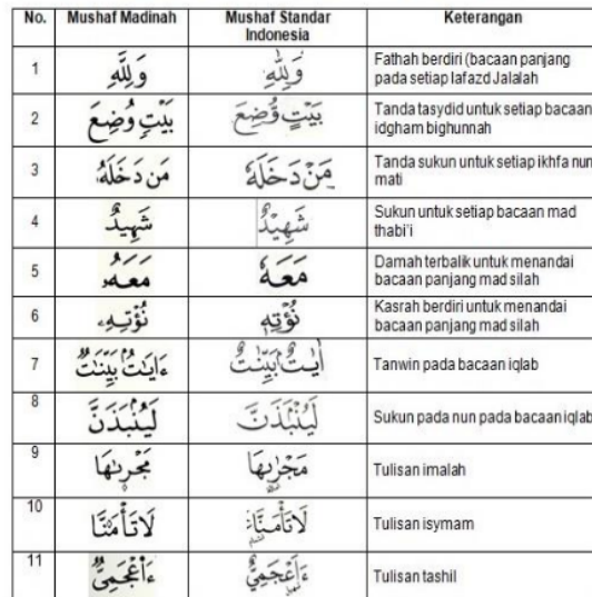
Tabel perbedaan tanda baca Mushaf Standar Indonesia dan Mushaf Madinah

Di Indonesia sendiri untuk cetakan mushaf Al-Quran memiliki standar disebut dengan istilah Rasm Usmani . Rasm Usmani adalah tata cara penulisan Al-Quran yang dibakukan pada masa Khalifah Usman Bin Affan (25 H/ 646 M) [13]. Cetakan Al-Quran standar Indonesia ini juga tampak mirip dengan cetakan Al-Quran Madinah yang sama menggunakan Rasm Usmani , namun tetap memiliki perbedaan juga [14]. Berikut adalah perbedaannya.