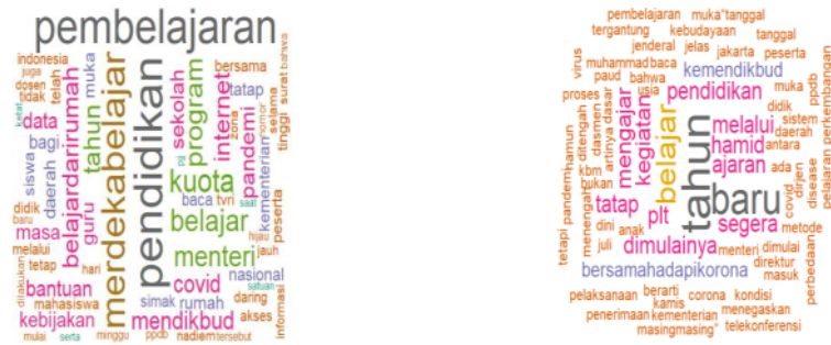
GAMBAR 1 VISUALISASI WORD CLOUD UNGGAHAN TERKAIT KEBIJAKAN PENDIDIKAN DI MASA PANDEMI OLEH AKUN RESMI . UNGGAHAN POSITIF (KIRI), UNGGAHAN NEGATIF (KANAN), DI MEDIA SOSIAL FACEBOOK

sedangkan UN 2021 memiliki pengaruh negatif paling banyak. sentimen positif dan negatif. Gambar 3 menunjukkan bahwa konten belajar di rumah, kuota internet gratis, Hasil WordCloud menunjukkan bahwa konten belajar di rumah, kuota internet gratis, UN 2020 ditidakan memiliki pengaruh yang positif, sedangkan UN 2021 memiliki pengaruh negatif paling banyak.