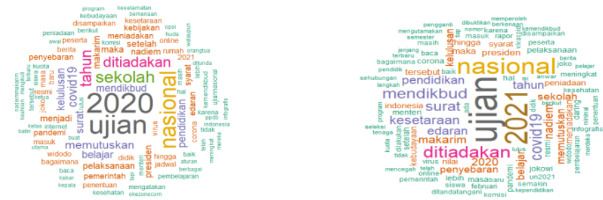
GAMBAR 2 VISUALISASI WORD CLOUD UNGGAHAN TERKAIT KEBIJAKAN PENDIDIKAN DI MASA PANDEMI OLEH AKUN PORTAL BERITA. UNGGAHAN POSITIF (KIRI), UNGGAHAN NEGATIF (KANAN), DI MEDIA SOSIAL FACEBOOK