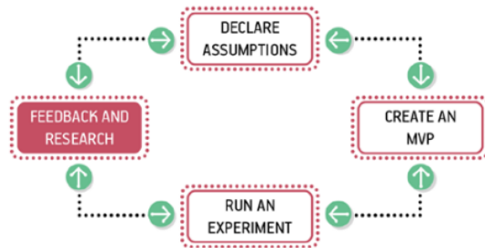
Gambar 4. Proses Lean UX Timbal Balik dan Riset.

Tahap penelitian pada lean UX menggunakan teknik dasar yaitu berkelanjutan dan kolaborasi. Teknik berkelanjutan memasukkan aktivitas penelitian ke dalam setiap sprint . Teknik kolaborasi tidak bergantung pada peneliti khusus untuk mendapatkan apa yang ingin dipelajari.