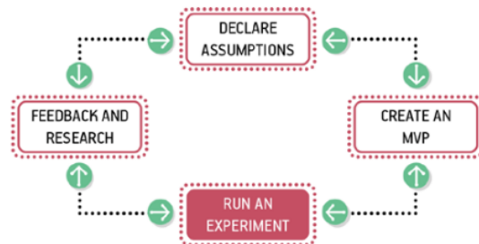
Gambar 3. Proses Lean UX Melakukan Eksperimen.

Salah satu alat yang paling efektif dalam pembuatan MVP adalah pembuatan prototipe pengalaman. Pembuatan prototipe tidak selalu langsung prototipe jadi yang sudah hampir mirip dengan produk asli.