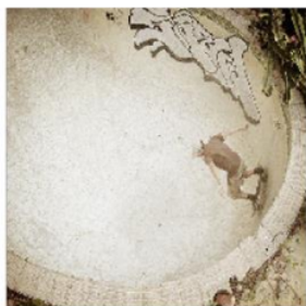
Gambar 1. Contoh gambar dan deskripsinya

a man on a skateboard rides on the inside wall of an empty swimming pool A man riding a skate board in an empty swimming pool. A man on a skateboard doing tricks in a pool A skate board enthusiast enjoying riding inside an old swimming pool a person riding a skate board in an empty pool