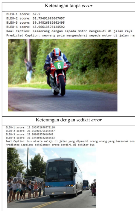
TABEL 2. HASIL PREDIKSI KALIMAT DAN SKOR BLEU

Hasil kualitatif, beberapa gambar dengan kalimat yang dihasilkan oleh model ditunjukkan dan kualitasnya juga dijelaskan dalam Tabel 2. Sebagian besar kalimat yang dihasilkan memiliki tata bahasa yang benar.