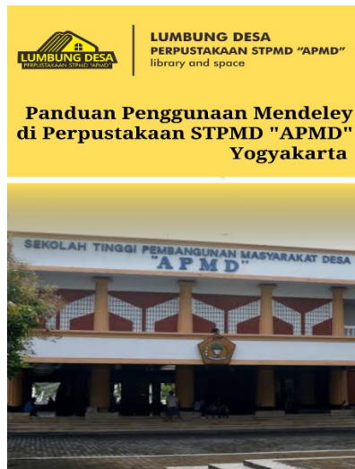
Gambar 1. Buku panduan penggunaan Mendeley

Perpustakaan STPMD "APMD", sudah mempunyai buku panduan penggunaan Mendeley. Perpustakaan memiliki rencana untuk membagikan buku panduan satu persatu kepada seluruh mahasiswa di Sekolah Tinggi Pembangunan Masyarakat Desa "APMD" Yogyakarta. Buku panduan ini, diharapkan bisa membantu mahasiswa agar lebih mudah menginstal dan mengoperasikan Mendeley, serta bisa membuat sitasi dan daftar pustaka dengan lebih baik, sehingga mengurangi risiko plagiarisme.