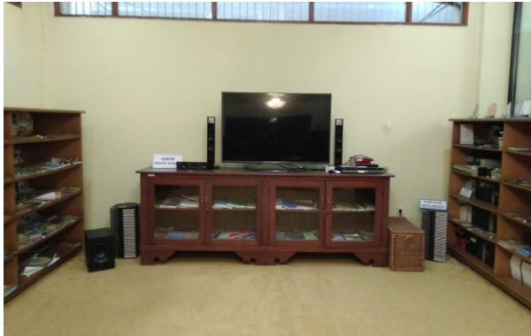
Gambar 3. Fasilitas audiovisual dan alat gambar

Semua koleksi di Kid's Corner ditujukan untuk kegiatan literasi bagi anak-anak. Menurut Asaniyah (2022) tujuan utama layanan anak di perpustakaan antara lain menyediakan koleksi yang menarik dan mudah dipahami oleh anak-anak. Pustakawan mempunyai kewajiban membantu memilih buku dan alat peraga yang dibutuhkan anak-anak. Pustakawan berperan penting dalam mengenalkan dan mengajak anak-anak gemar membaca buku sehingga kegiatan tersebut menjadi kebiasaan yang perlu terus dipupuk. Melalui permainan atau gim edukatif, pustakawan berupaya mengembangkan kreativitas anak.