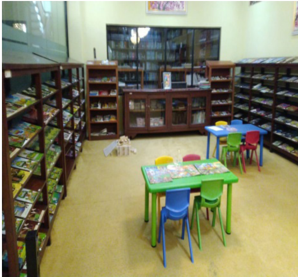
Gambar 1. Ruang Kid's Corner