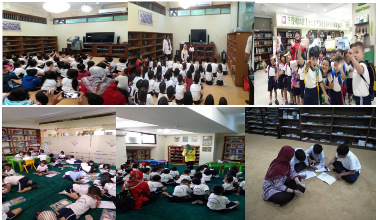
Gambar 5. Aktifitas di Kid's Corner

pengertian. Pemutaran video juga lebih mengekalkan pengetahuan yang diperoleh serta mendorong rasa ingin tahu yang lebih besar.