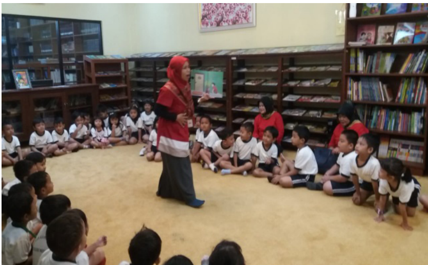
Gambar 4. Kegiatan Mendongeng di Kid's Corner

Setelah ada " chemistry " antara pustakawan dan anak-anak, pustakawan mulai mengenalkan buku untuk dibaca sesuai dengan tema dongeng. Salah satu dongeng yang sering disampaikan pustakawan untuk mengenalkan padi adalah dongeng Dewi Padi, Dewi Sri. Dongeng Dewi Sri menyiratkan nilai moral dalam membentuk karakter yang baik.