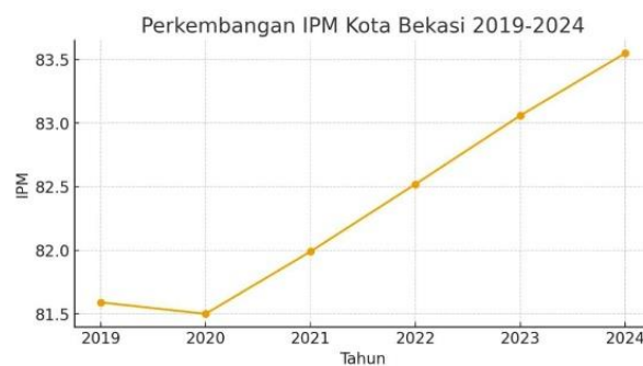
Gambar 1. Data IPM Kota Bekasi

Periode tahun 2019-2024 terjadi perubahan signifikan yang dipengaruhi oleh perubahan kondisi ekonomi, baik ditingkat nasional maupun global, terutama akibat dari pandemic COVID 19. Penurunan signifikan Indeks Pembangunan Manusia ( IPM ) pada tahun 2020 menjadi fokus utama dalam analisis dampak pandemi COVID-19 terhadap kualitas kehidupan masyarakat. Pada masa tersebut, IPM Kota Bekasi mengalami penurunan sebesar -0,11%, yang mencerminkan gangguan serius pada dimensi kesehatan, pendidikan, serta standar hidup masyarakat. Penurunan ini tidak terlepas dari peningkatan tajam tingkat pengangguran dan kemiskinan yang disebabkan oleh pembatasan sosial dan perlambatan ekonomi yang melanda berbagai sektor kehidupan (Dewi Nuril Afifah et al, 2025).