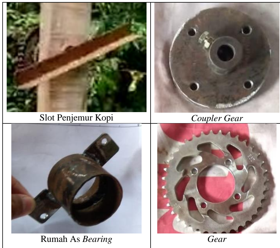
Gambar 2. Komponen-komponen Alat Penjemur Kopi

Dalam tahap pendesainan model dan mekanisme alat, terdapat satu kali revisi desain dikarenakan adanya ketidakmungkinan dalam dunia nyata jika model tersebut direalisasikan. Dalam pembuatan komponen juga terdapat revisi hampir semua model komponen, kecuali model komponen yang beli di toko spare-part motor saja seperti rantai, gear , dan bearing dikarenakan sudah dalam bentuk jadi ketika dibeli. Pembuatan komponen alat penjemur kopi dibagi menjadi dua tempat, yaitu pembuatan komponen dari logam dan pembuatan komponen dari kayu. Sebagian komponen-komponennya dapat dilihat pada gambar 2 berikut ini: