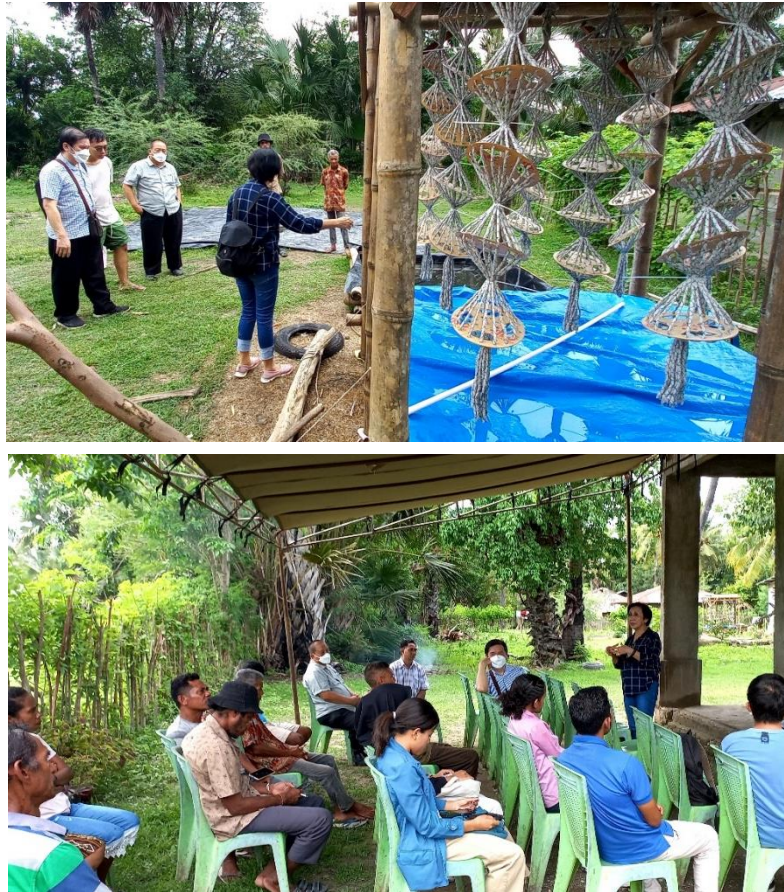
Gambar 11. Sosialisasi Hasil Uji Coba 3D Rope Evaporator ke Komunitas Petani Garam Desa Olio