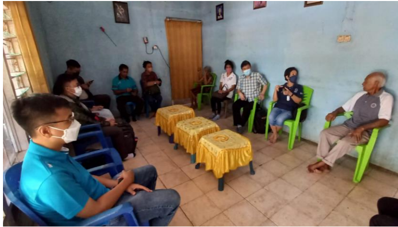
Gambar 5. Pertemuan Dengan Perwakilan Petani Garam Desa Olio, NTT

Pertama, tim pengabdian melakukan perjalanan dinas ke Kupang, NTT untuk melakukan komunikasi secara langsung dengan mitra pengabdian. Kegiatan ini berlangsung pada Juni dan November 2022. Selama periode tersebut, tim pengabdian melakukan berbagai diskusi dengan kedua mitra tersebut untuk merencanakan segala keperluan teknis dan non teknis dalam rangka realisasi rencana kegiatan pengabdian masyarakat ini. Lebih jauh, saat kunjungan ke Desa Olio sebagai tempat pengabdian, tim pengabdian melakukan diskusi dengan perwakilan komunitas petani garam di desa tersebut. Diskusi yang dilakukan dengan petani garam tersebut bertujuan untuk mengetahui dan mengidentifikasi permasalahan yang dihadapi oleh petani garam.