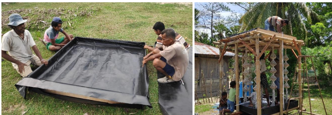
Gambar 9. Pembuatan 3D Rope Evaporator

Alat 3D rope evaporator yang telah dibangun kemudian dievaluasi kinerjanya. Pengambilan data ini kemudian diteliti dan dianalisis untuk mendapatkan gambaran terkait performa alat dan seberapa besar kebermanfaatannya apabila diterapkan oleh petani garam Desa Olio. Proses ini menjadi sangat penting. Data uji coba ini menjadi bukti untuk petani garam supaya mereka mau berinvestasi dalam pembuatan alat yang lebih besar. Data uji coba tersebut kemudian disosialisasikan kepada petani garam. Dalam sosialisasi tersebut tim pengabdian dan mahasiswa MBKM mempresentasikan hasil pengujian alat yang diperoleh.