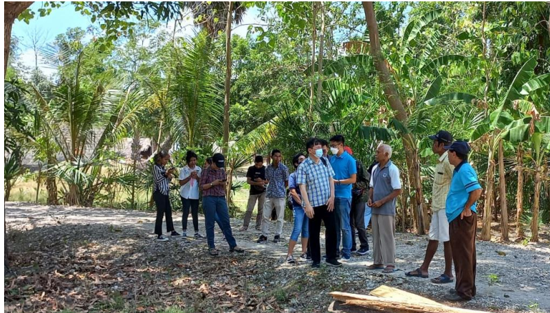
Gambar 6. Survei lapangan untuk pembangunan 3D rope evaporator