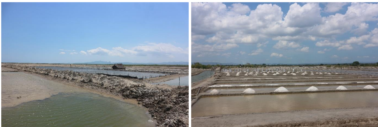
Gambar 1. Tambak Garam di Desa Olio, NTT

Desa Olio, desa yang berada di Kabupaten Kupang, Provinsi Nusa Tenggara Timur (NTT), merupakan suatu wilayah yang menjadikan produksi garam rakyat sebagai salah satu sumber ekonomi dari masyarakatnya. Selama ini, produksi garam di desa tersebut menggunakan metode penguapan air laut secara konvensional. Metode tersebut dilakukan dengan memanfaatkan tambak garam yang terbuka dan luas sebagai media penguapan serta sinar matahari sebagai sumber panasnya (Wanta dkk., 2023; Ruslan dkk., 2020). Bentuk tambak garam yang dimaksud terilustrasi seperti pada Gambar 1. Metode ini memang tergolong sebagai metode yang sederhana sehingga mudah untuk diaplikasikan. Akan tetapi, penggunaan tambak garam tersebut memiliki beberapa kelemahan, di antaranya membutuhkan lahan horizontal yang luas, produk garam yang dihasilkan memiliki kemurnian yang rendah (khususnya apabila ada angin kencang, debu, dan tanah), dan membutuhkan waktu produksi yang lama (Jayanthi dkk., 2021; Mashuri dkk., 2021; Nasution dkk., 2019; Bramawanto, 2017). Dengan melihat kondisi dan kelemahan tersebut, teknologi tepat guna sangat penting untuk diterapkan sehingga petani garam di Desa Olio dapat memproduksi garam rakyat secara efektif dan efisien.