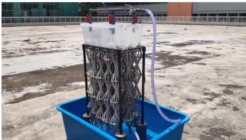
Gambar 3. Ilustrasi 3D Rope Evaporator

Secara sederhana, prinsip kerja dari alat ini dapat diibaratkan serupa dengan menjemur pakaian. Proses penguapan tidak hanya terjadi akibat adanya panas dari sinar matahari saja, melainkan juga karena adanya tiupan angin dari lingkungan sekitar. Ilustrasi dari alat ini tersaji pada Gambar 3.