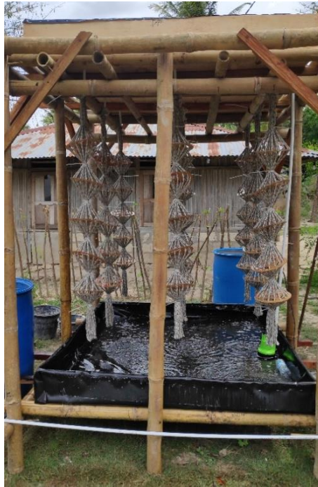
Gambar 10. 3D rope evaporator yang dibangun di Desa Olio, NTT

dibandingkan dengan penggunaan tambak garam konvensional. Selain itu, perwakilan petani garam tersebut juga menyatakan bahwa produk garam yang dihasilkan lebih halus dan putih. Hal ini menandakan bahwa kualitas garam yang diproduksi jauh lebih baik dan murni. Data uji coba dan testimoni ini mampu meyakinkan dan menguatkan niat petani garam lainnya untuk menerapkan teknologi ini pada musim produksi saat kemarau berikutnya.