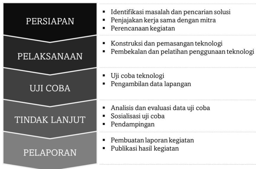
Gambar 4. Tahapan Kegiatan Pengabdian Kepada Masyarakat di Desa Olio

Pengabdian kepada masyarakat ini melibatkan mitra komunitas petani garam Desa Olio, Kabupaten Kupang, Provinsi Nusa Tenggara Timur. Kegiatan ini dimulai sejak Juni 2022 dan masih berlangsung hingga saat ini. Untuk mencapai tujuan kegiatan yang telah disampaikan pada bab Pendahuluan, pelaksanaan kegiatan ini terdiri dari beberapa bentuk, yaitu kegiatan diskusi, penyuluhan dan pelatihan, penerapan teknologi sebagai percontohan, demonstrasi penggunaan teknologi, dan pendampingan. Tahapan kegiatan ini digolongkan menjadi lima tahap, yaitu tahap persiapan, pelaksanaan, uji coba, tindak lanjut, dan pelaporan. Kelima tahapan tersebut memiliki kegiatan masing-masing. Gambar 4 menjelaskan lebih detail bagaimana kegiatan pengabdian ini berjalan.