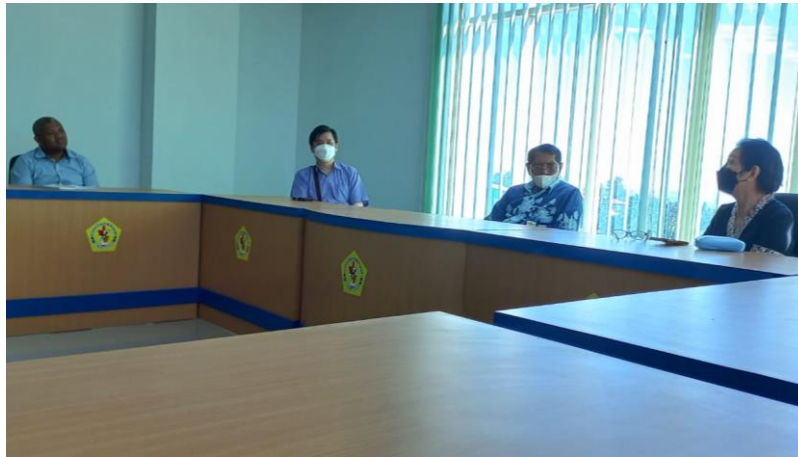
Gambar 8. Diskusi dengan UNWIRA (Dokumentasi Pribadi)

Setelah tahapan persiapan selesai, kegiatan pengabdian dilanjutkan dengan tahap pelaksanaan di mana kegiatan utamanya adalah pembangunan alat 3D rope evaporator yang telah dirancang sebelumnya. Proses pembangunan ini dilakukan dengan memanfaatkan sumber daya yang ada di desa setempat dan dapat dilihat pada Gambar 9. Karena adanya keterbatasan dana, alat yang dibangun masih bersifat prototipe terlebih dahulu. Selain sebagai percontohan alat, prototipe yang dibangun ini juga menjadi media untuk membuktikan dan meyakinkan petani garam setempat bahwa teknologi yang dikembangkan dan dibangun merupakan solusi yang tepat. Lebih lanjut, apabila teknologi ini dapat memberikan hasil yang baik, maka petani garam diharapkan dapat melakukan scale-up alat ke tambak garam yang lebih besar. Prototipe yang dibangun dapat dilihat pada Gambar 10.