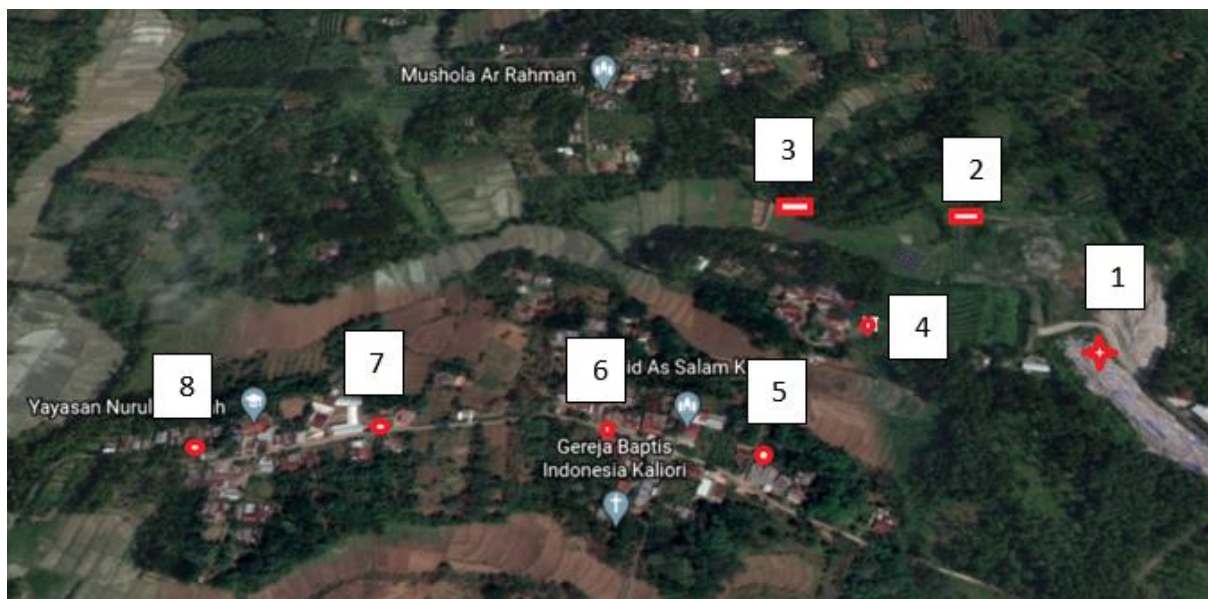
Gambar 1. Lokasi Pengambilan Sampel, TPA Kaliori Banyumas