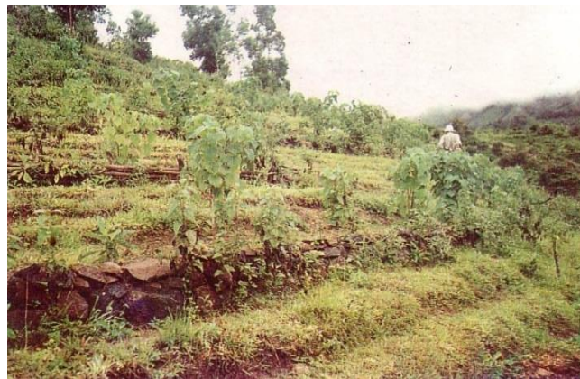
Gambar 4. Contoh bangunan batu penahan dengan kombinasi vegetasi yang mulai berfungsi kembali untuk menata lingkungan