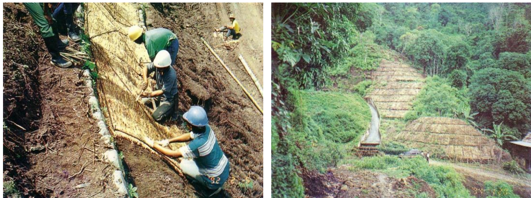
Gambar 10. Pembuatan teras jerami pada lahan miring

Bangunan teknis teras jerami dapat digunakan pada lahan dengan kelerengan curam dengan kondisi sangat kritis. Permukaan tanah ditutup dengan hamparan jerami yang diikat sedemikian rupa pada patok-patok yang ditancapkan dalam tanah. Permukaan tanah dapat terlindungi dari pukulan butir-butir hujan serta memperlambat aliran air dan mencegah erosi dan lonsor. Pada bagian bawah kelompok teras jerami dapat dibuat teras batu ( Stone terrace ) untuk memperkuat konstruksi dan memperlancar saluran drainase.