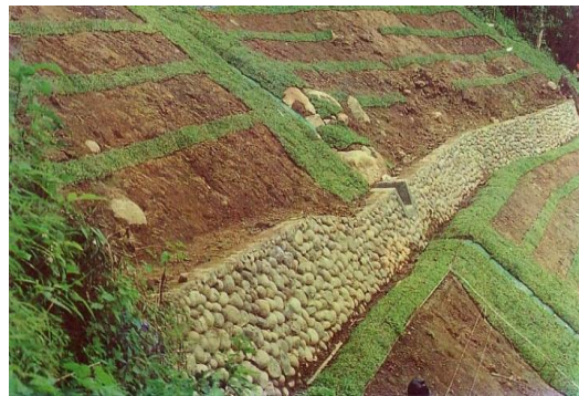
Gambar 2. Ilustrasi dan contoh bangunan tembok penahan ( wet masonry )