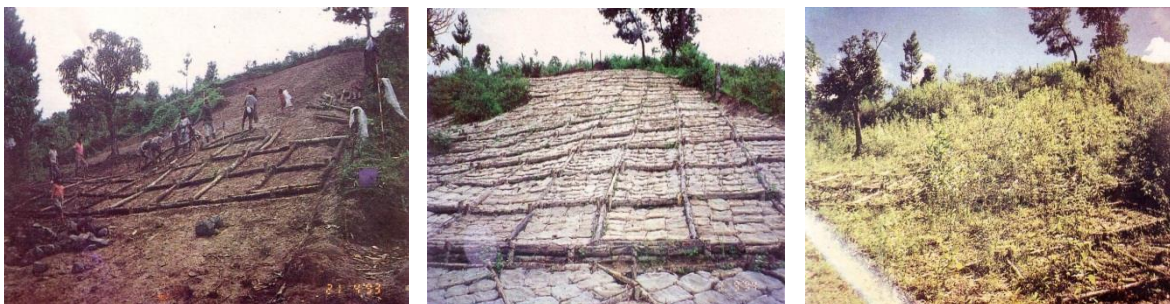
Gambar 7. Rangkaian pembuatan dan hasil dari teras kotak pada lahan kritis