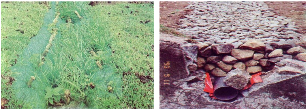
Gambar 11. Saluran terbuka tertutup rumput dan saluran tertutup batu.

Saluran tertutup mempunyai permukaan yang relatif rata dengan tanah. Untuk keperluan ini digunakan timbunan batu, agar aliran air kebawah menjadi lancar.