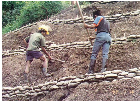
Gambar 9. Bangunan teras karung

Teras karung dapat digunakan sebagai salah satu cara untuk mengurangi erosi dan longsor. Karung yang berisi tanah dan campuran bahan organik, pada awalnya berfungsi sebagai konservasi teknik sipil. Campuran bahan organik yang terdapat dalam karung dapat membantu mempercepat pertumbuhan vegetasi, baik yang sengaja ditanam maupun yang tumbuh secara alami, sehingga lambat laun peranan konservasi teknik sipil digantikan dengan konservasi vegetatif.