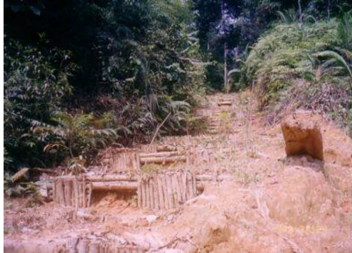
Gambar 1. Konservasi tanah pada bekas jalan sarad di kawasan hutan dengan kemiringan 10%.

Untuk melakukan perbaikan (konservasi) lahan kritis, terutama yang berada pada daerah yang mempunyai kelerengan, bangunan teknik sipil sebaiknya didahulukan dibuat, menyusul teknik konservasi vegetatif, yaitu dengan melakukan penanaman jenis cepat tumbuh ( fast growing species ), tanaman penutup ( cover crop ) baik jenis asli ( native species ) maupun luar ( exotic species ), dan atau memelihara pertumbuhan alam ( natural regeneration ). Perpaduan kedua teknik tersebut sangat tepat diterapkan untuk merehabilitasi lahan kritis. Beberapa bentuk tindakan konservasi tersebut adalah (Masaki, 1995):