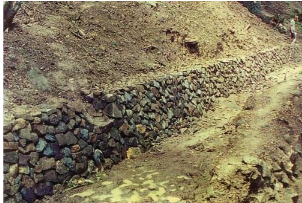
Gambar 3. Contoh bangunan batu penahan