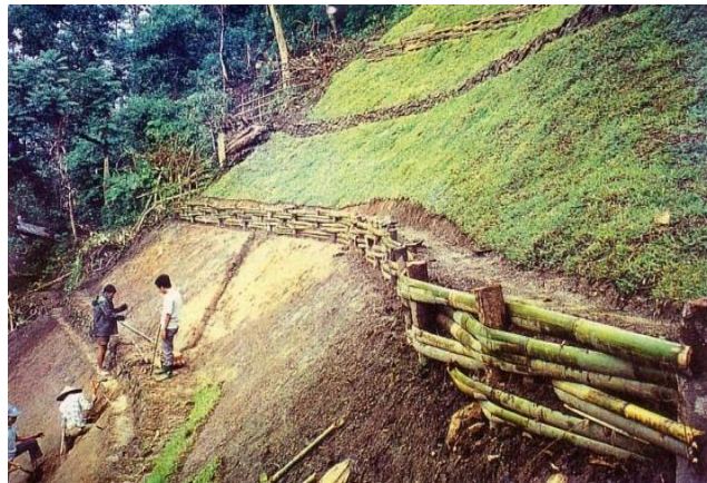
Gambar 8. Bangunan teras bambu pada lahan miring

Pada prinsipnya teras bambu dan ranting mirip dengan kayu penahan ( Log Retaining Works ). Perbedaan hanya terletak pada material yang digunakan serta cara pembuatan. Teras bambu dibuat dengan menganyam bambu pada kayu keras yang berfungsi sebagai patok. Sedangkan teras ranting dibuat dengan memanfaatkan sisa-sisa batang dan ranting pohon. Baik teras bambu maupun ranting, segera diikuti dengan konservasi vegetatif, karena usia bambu maupun kayu relatif pendek.