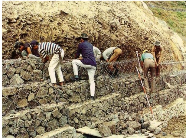
Gambar 5. Penggunaan kawat bronjong pada teras batu bertingkat