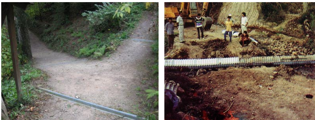
Gambar 12. Saluran terbuka dan tertutup atau gorong-gorong

Gorong-gorong adalah lubang saluran air tertutup yang mengalirkan air dari suatu tempat tergenang menuju ketempat lain yang lebih rendah. Gorong-gorong dapat dibuat dari log kayu yang gerowong atau menggunakan tabung besi. Penimbunan dilakukan menggunakan material jalan (tanah), sehingga tidak nampak dari atas. Saluran air yang berfungsi pula