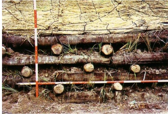
Gambar 6. Contoh bangunan teknis (konstruksi) kayu penahan