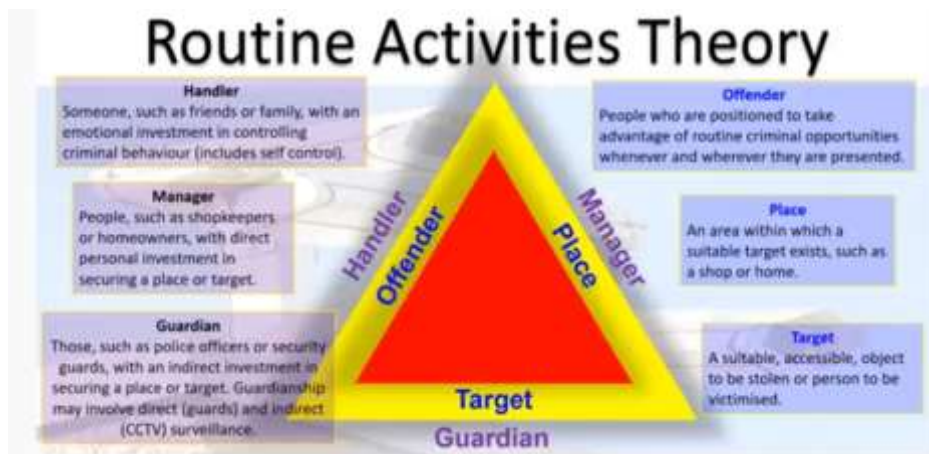
Gambar 1: The Crime Triangle of Routine Activity Theory