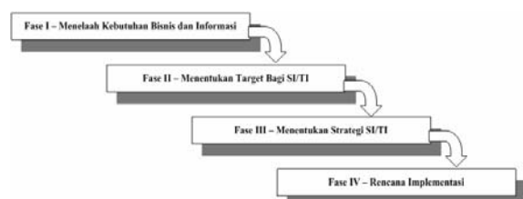
Gambar 2. Fase One Stop Method PSSI