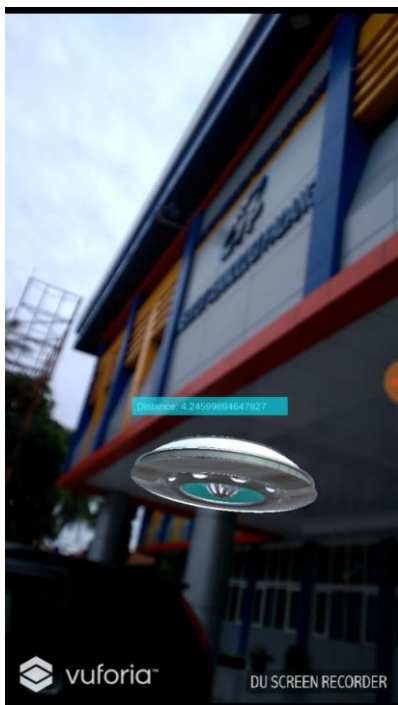
Gambar 3. Antarmuka real world camera view ARmaps

Jarak ( distance ) yang tampil pada antarmuka aplikasi diperoleh dengan menggunakan Persamaan (2). Variabel R pada Persamaan (1) merupakan radius satelit dari bumi yaitu sebesar 6378.137 KM, sementara itu variabel c pada