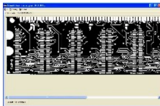
Gambar 2 Pola Grayscale PCB Master

Setelah dua buah citra tersebut diproses dengan menggunakan aplikasi template matching , maka terlihat hasil identifikasinya berupa lokasi dimana terdapat ketidakcocokan pola dan diasumsikan bahwa pada lokasi tersebut terdapat kecacatan PCB. Dalam hal ini titik-titik yang dianggap cacat karena tidak sesuai dengan citra pada master akan ditandai dengan blok korelasi berwarna merah dimana ukuran blok korelasi tersebut telah ditentukan sebelumnya oleh user . Gambar 4 menunjukkan output hasil template matching pada PCB input. Pada Gambar 4 tersebut terlihat adanya blok korelasi pada titik yang dianggap cacat karena memiliki kesalahan berupa putusya jalur sirkuit PCB.