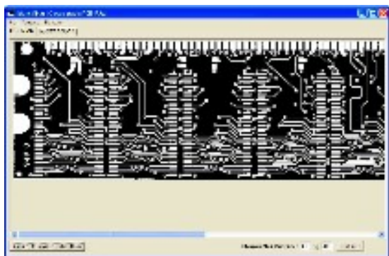
Gambar 3 Pola PCB Yang siap diidentifikasi