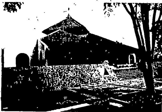
Masjid Sa'id Naum, Jakarta contoh pendekatan modern dengan cara adaptasi.