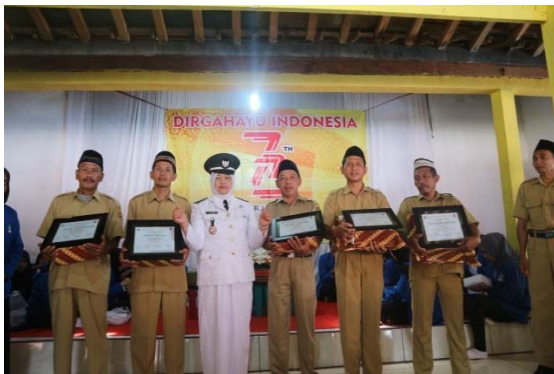
Gambar 5. Pendampingan Sadar Wisata dan Sapta Pesona