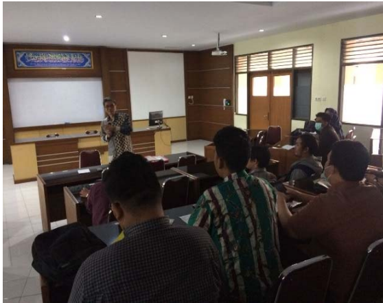
Gambar 1. Pembekalan dan Kewilayahan

program suatu wilayah”. Pelaksanaannya dilakukan pada 21 Juli 2018.