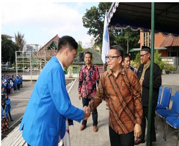
Gambar 2. Pelepasan dan Penerjunan Mahasiswa KKN PPM

Pelaksanaan pengarahannya, pelepasan dan penerjunan mahasiswa ini dimaksudkan untuk pembekalan umum oleh pejabat Rektorat untuk memberikan motivasi, dukungan dan arahan selama pelaksanaan KKN, diharapkan mahasiswa mampu menjaga diri, bersosialisasi dan bertugas menyelesaikan kegiatan KKN dengan baik dan benar.