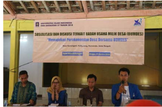
Gambar 6. Pelatihan penguatan BUMDES

Kegiatan ini dilaksanakan sebagai upaya dalam memperbaiki kelembagaan desa wisata yang ada. Regenerasi kepada generasi muda sangat diperlukan dalam optimalisasi pengembangan desa wisata di Somongari. Tahapan kegiatan meliputi: Pendampingan manajemen kelembagaan, keuangan, Jaringan dan Networking .