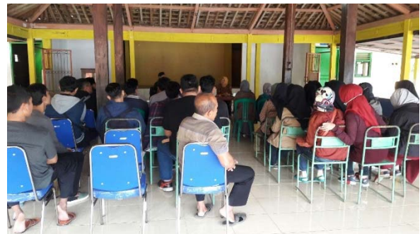
Gambar 3. Koordinasi KKN PPM dengan Desa

mempersiapkan masyarakat sasaran untuk terlibat kegiatan yang disepakati bersama masyarakat. Mahasiswa KKN menjalankan program kegiatan dimulai dari proses pertemuan bersama masyarakat sasaran, dimaksudkan mewujudkan atau membangun kesepahaman dan kesepakatan dalam kerjasama pelaksanaan KKN PPM.