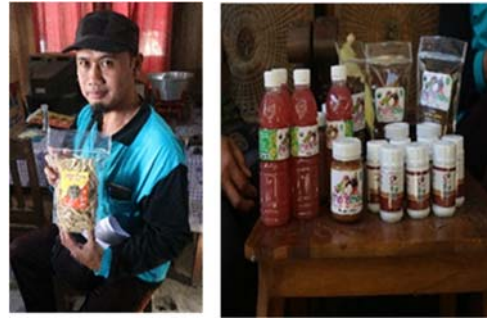
Gambar 8. Salah satu Produk kkn dan pengemasan

Salah satu dalam mendukung keberadaan desa wisata adalah adanya oleh-oleh yang berupa makanan. Desa Somongari sejak ditetapkan sebagai desa wisata belum mempunyai hasil oleh-oleh tersebut. Sebagai Desa penghasil durian dan manggis terbesar di kabupaten Purworejo, pemanfaatannya belum dapat dirasakan sebagai makanan khas oleh-oleh dari desa ini. Sehingga kegiatan yang dilakukan dalam KKN PPM ini diantaranya pelatihan pembuatan makanan khas dari Durian dan Manggis, pendampingan pengemasan makanan, dan pelatihan pembuatan souvenir sebagai ciri khas Desa Somongari.