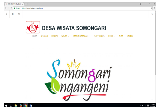
Gambar 7. Salah satu Media online dampingan

Kelemahan dalam pengembangan desa wisata di Somongari diakibatkan dari media pemasaran yang dilakukan masih bersifat konvensional, belum melakukan pemasaran melalui media online. Keterbatasan tersebut dikarenakan media yang ada selama ini belum dikelola dengan baik. Faktor tersebut akibat dari tidak adanya peran generasi muda yang mengelola media online tersebut.