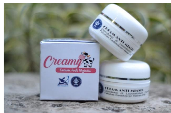
Gambar 2: Kemasan CREAMY

CREAMY merupakan produk obat antimyiasis yang aman, efektif, dan ekonomis. CREAMY dikemas dengan kemasan ekonomis yaitu pot 20 gram. Setiap satu pot 20 gram dijual dengan harga Rp30.000.