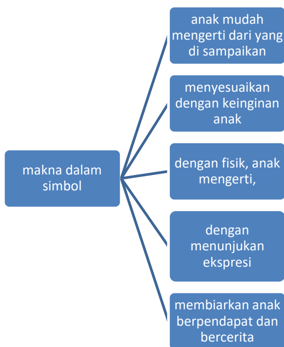
Gambar 1. Makna dalam simbol

Dari keempat pernyataan informan, dapat disimpulkan bahwa dalam memberikan makna dalam simbol-simbol di kehidupan kita sangat penting agar anak mudah mengetahui dari apa yang kita lakukan. Dengan begitu, anak akan meniru dengan baik. Hal itu juga dapat membantu anak dalam mengaitkan informasi dengan menghubungkan informasi yang disampaikan dengan pengalaman nyata anak.