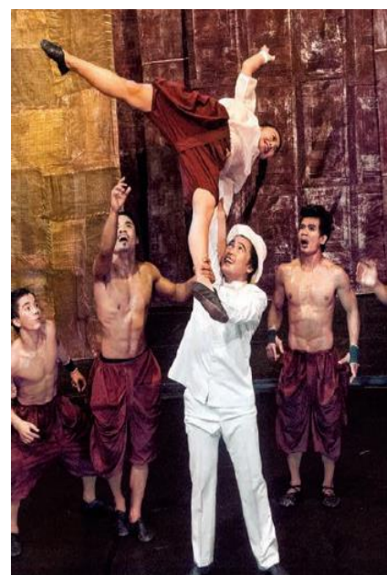
Gambar 2 Penampilan Atraksi Lokal Menjadi Global dengan Tujuan Pariwisata

Namun, penggambaran dalam artikel atau media pariwisata termasuk juga majalah maskapai penerbangan menjadi klise dimana mereka hanya memberikan hal-hal positif demi mengkonstruksikan ruang agar menghasilkan liburan yang sesuai dengan apa yang diharapkan. Penampilan tersebut memberikan penggambaran mengenai