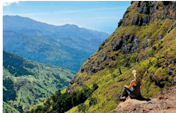
Gambar 1 Penampilan Ruang Pemandangan Alam dalam Konstruk Global