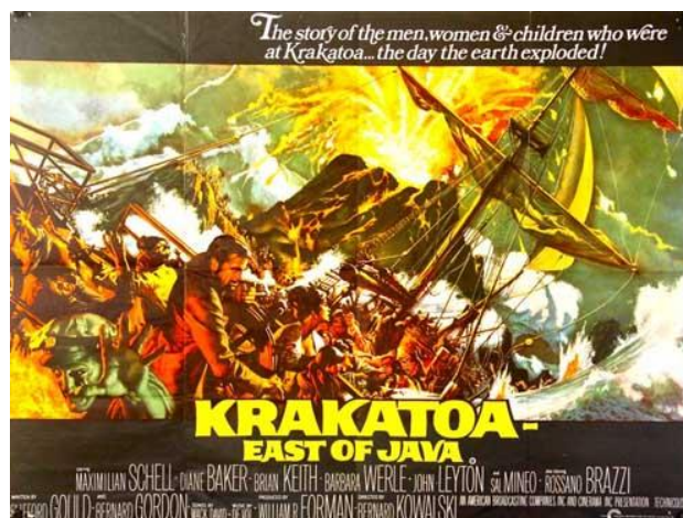
Gambar 3 . Poster Film Krakatoa: East of Java

Salah satu film klasik menggambarkan tentang letusan gunung Krakatau dengan judul Krakatoa: East Of Java (1969). Film ini memiliki kesalahan judul karena Krakatau berlokasi di Pulau Jawa bagian barat, bukan di sebelah timur Pulau Jawa.