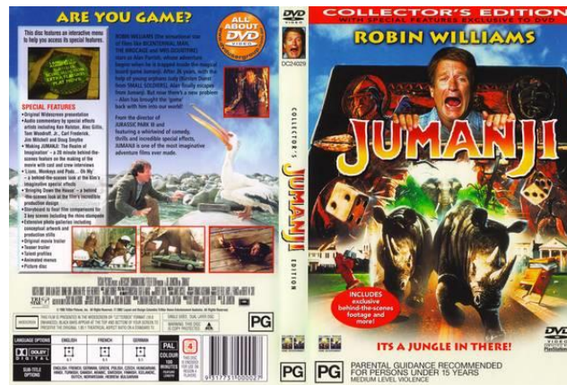
Gambar 1. Sampul Film Jumanji

Selain itu, seorang gadis berbicara bahasa Indonesia di sebuah film Hollywood berjudul Bob Funk (2009). Dia berkata pada seorang lelaki yang menggodanya “Orang bule, saya minta maaf saya tidak mengerti kamu ngomong bahasa apa. Saya hanya bisa bahasa Indonesia, tidak bisa bahasa Inggris seperti kamu”. Gadis tersebut kemudian dipandang aneh dan lelaki tersebutpun membatalkan niatnya menggoda sang gadis.