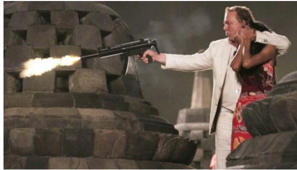
Gambar 4. Film Java Heat yang berlokasi di Candi Borobudur

proses shooting di Candi Borobudur dan sejumlah spot di Yogyakarta.