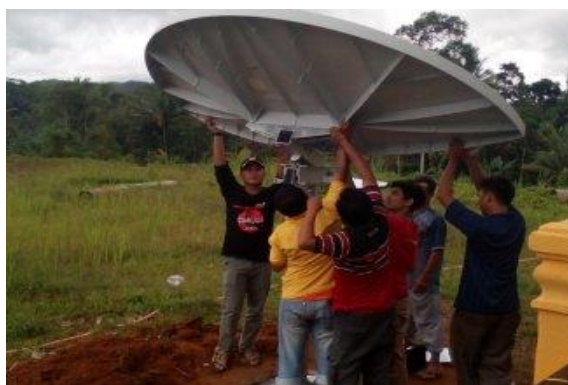
Gambar 5. Pemasangan Alat Metrasat Bantuan Kemkominfo sebagai Penyedia Jaringan Internet di Desa Cikadu

Kurangnya pembinaan dari pemerintah dari tingkat kabupaten sampai provinsi juga dirasakan oleh relawan TIK Desa Cikadu. Bahkan sebagai desa terpencil, belum pernah menerima kunjungan dari pemerintah. Namun, setelah mempunyai website desa dan mulai mengunggah informasi-informasi terkait kondisi desa, pemerintah mulai memperhatikan melalui kunjungan Wakil Gubernur Jawa Barat, Kemkominfo melalui BP3TI dan BP2DK (Nuroni, 2017).