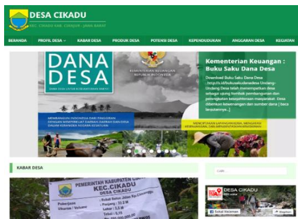
Gambar 2. Website Desa Cikadu.desa.id

itu peneliti melakukan observasi online pada isi website desa Cikadu di alamat cikadu.desa.id.