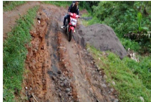
Gambar 3. Kondisi jalan Desa Cikadu