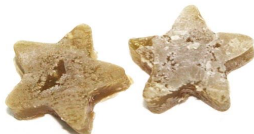
Gambar 7. Gummy candies formula 5.