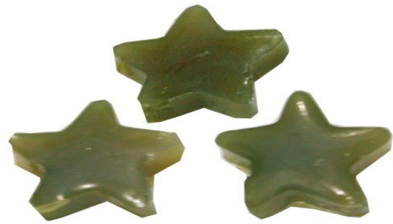
Gambar 5. Gummy candies formula 3.