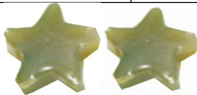
Gambar 4. Gummy candies formula 2.