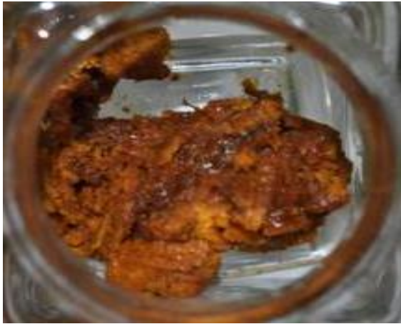
Gambar 2. Sari buah belimbing manis.

material yang mengandung sukrosa yang dapat menyebabkan hasil akhir tidak berbentuk serbuk kering (Anonim, 2008).