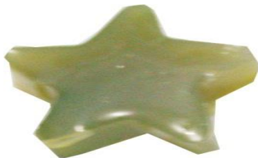
Gambar 3. Gummy candies formula 1.