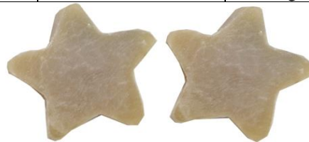
Gambar 6. Gummy candies formula 4.