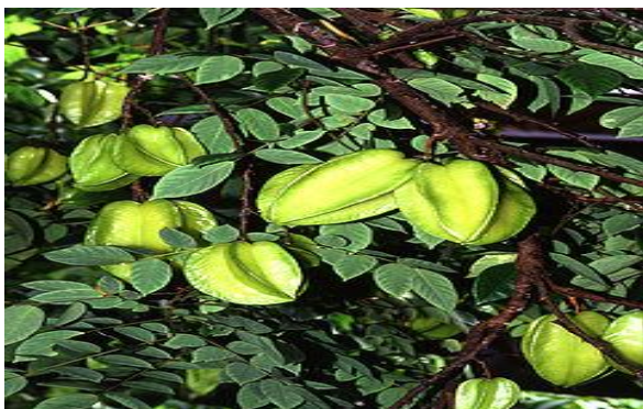
Gambar 1. Buah belimbing manis ( Averrhoa carambola L.) (Teknopro, 2002)

Dari hasil determinasi dapat dipastikan bahwa tanaman tersebut adalah tanaman belimbing manis. Seperti telah diketahui bahwa buah belimbing manis mengandung vitamin C sebanyak 33 mg dan vitamin A sebanyak 61 IU dalam 100 gram buah belimbing manis, dan berbagai jenis vitamin serta mineral lainnya. Oleh karena itu formulasi ini bertujuan untuk memformulasikan sari buah belimbing manis dalam bentuk gummy candies .