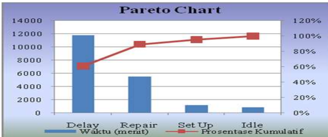
Gambar 2. Diagram Pareto.

Human error yang disebabkan kelelahan merupakan salah satu faktor penyebab terjadinya keterlambatan dalam proses produksi, sehingga fokus operator mengerjakan pekerjaannya berkurang.