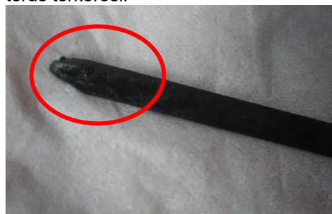
Gambar 2. Sampel Logam yang Terkorosi

Pada pengujian inhibitor korosi ekstrak daun trembesi dihasilkan paling optimum yaitu pada penambahan ekstrak daun trembesi sebanyak 9 mL dengan laju korosi 0,008989 cm/year. Ketika penambahan inhibitor sebanyak 12 mL, terjadi kenaikan laju korosi menjadi 0.009162 cm/year. Berbeda pada umumnya yakni ketika jumlah inhibitor semakin banyak maka laju korosi yang dihasilkan akan semakin menurun. Hal ini dimungkinkan bahwa Fe-tannat tidak melapisi logam secara sempurna sehingga terdapat bagian tertentu yang terkorosi, seperti yang ditunjukkan pada Gambar 3. [14] Terdapatnya bagian yang terkorosi oleh HCl menyebabkan Fe-tannat sulit untuk melapisi bagian tersebut sehingga akan terus terkorosi. [8]