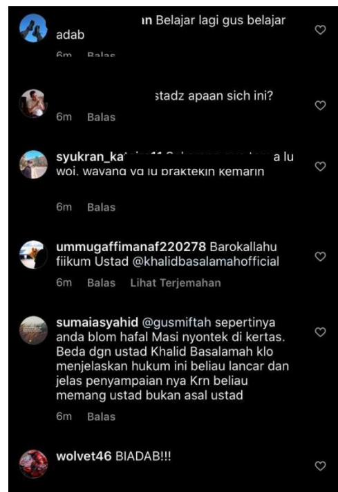
Gambar 3.2.2 Argumen Salafi Terhadap Moderat di Instagram

Dari gambar diatas dapat kita saksikan bahwa kelompok Islam yang paling mencolok keterlibatannya dalam war di media sosial adalah kelompok Salafi dan moderat, kontestasi wacana keagamaan yang terjadi antar dua kelompok dengan manhaj yang berbeda, baik Sunni berupa NU dan Muhammadiyah yang mengkritik Salafi karena menafsirkan al-Quran dan Hadis secara tekstual sehingga terkesan kaku dan kehilangan makna sesungguhnya atau Salafi yang membalas argumen NU dengan landasan kembali kepada al-Quran dan Sunnah untuk menghindari perkara bid'ah ataupun kesesatan.