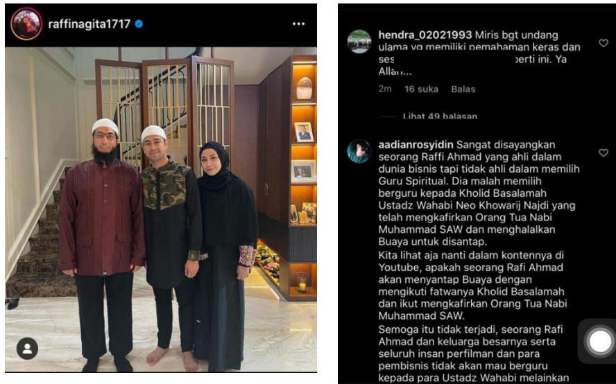
Gambar 3.2.4 Momen Raffi Ahmad bersama Ustad Khalid Basalamah yang menuai pro dan kontra

menyimpang dan tidak sesuai dengan pemahaman kelompoknya masing-masing yang memicu perdebatan dan mengandung hate speech atau ujaran kebencian. Prasangka tersebut berupa penilaian terhadap value suatu kelompok melalui potongan-potongan kejadian yang menimbulkan kesan lalu dirangkum dan disimpulkan dengan cara yang paling masuk akal.