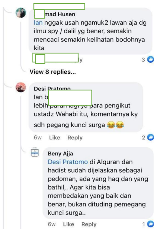
Gambar 3.2.1 Argumen Moderat Terhadap Wahabi di Facebook

Adapun hasil dokumentasi kegiatan dalam media sosial seperti Facebook dan Instagram, war terjadi dikarenakan bertemunya beberapa kubu kelompok yang tidak bisa saling menerima perbedaan pendapat pada kelompok lain dikarenakan berbeda dengan ulama atau da'i yang diyakininya baik dalam segi manhaj, pendapat serta cara pandang terhadap suatu masalah, sebagai berikut :