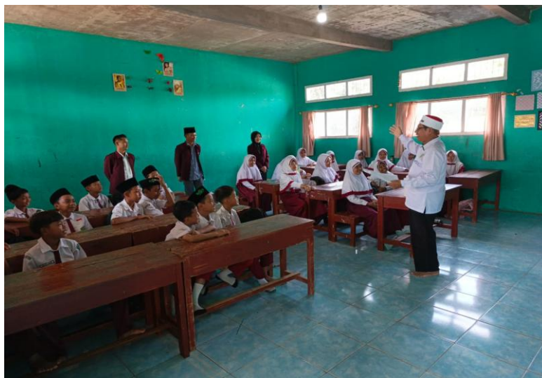
Gambar 1. Pembelajaran dikelas dengan mengimplementasikan KBC

Pelaksanaan pembelajaran Fiqih di MI Bustanul 'Ulum menampilkan beberapa indikator implementasi kurikulum berbasis cinta yang dapat diidentifikasi secara konkret. Pertama, guru membuka setiap sesi pembelajaran dengan sapaan yang hangat, doa bersama, dan penanyaan kondisi peserta didik. Praktik ini menciptakan iklim emosional yang positif sebelum memasuki materi akademik.