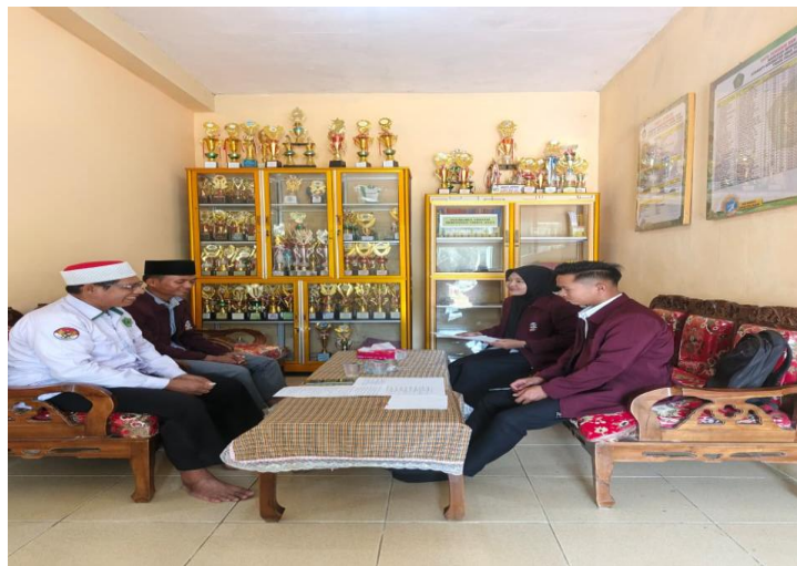
Gambar 2. Wawancara dengan Guru Fiqih MI Bustanul 'Ulum

Ketiga, guru secara konsisten memberikan umpan balik yang bersifat konstruktif dan afirmatif. Ketika seorang peserta didik memberikan jawaban yang kurang tepat, guru tidak langsung menyalahkan, melainkan memberikan scaffolding (perancah) secara bertahap. Pendekatan ini mencerminkan prinsip positive reinforcement yang dikemukakan oleh Skinner, sekaligus nilai kasih sayang dalam tradisi pedagogis Islam.