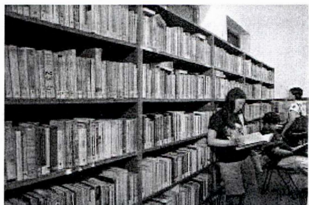
Gambar Perpustakaan Umum

Kata perpustakaan berasal dari kata pustaka, yang berarti: kitab, buku-buku, kitab primbon. Kemudian kata pustaka mendapat awalan per- dan akhiran -an, menjadi perpustakaan. Perpustakaan mengandung arti: kumpulan buku-buku bacaan, bibliotek, dan buku-buku kesusastraan (Kamus Besar Bahasa Indonesia-KBBI). Selanjutnya ada pula istilah pustakaloka yang berarti tempat atau ruangan perpustakaan.