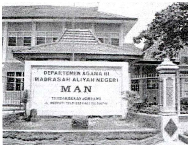
Gambar MAN Tambakberas

lingkungan Pondok Pesantren Bahrul Ulum Tambakberas Jombang Jawa Timur.