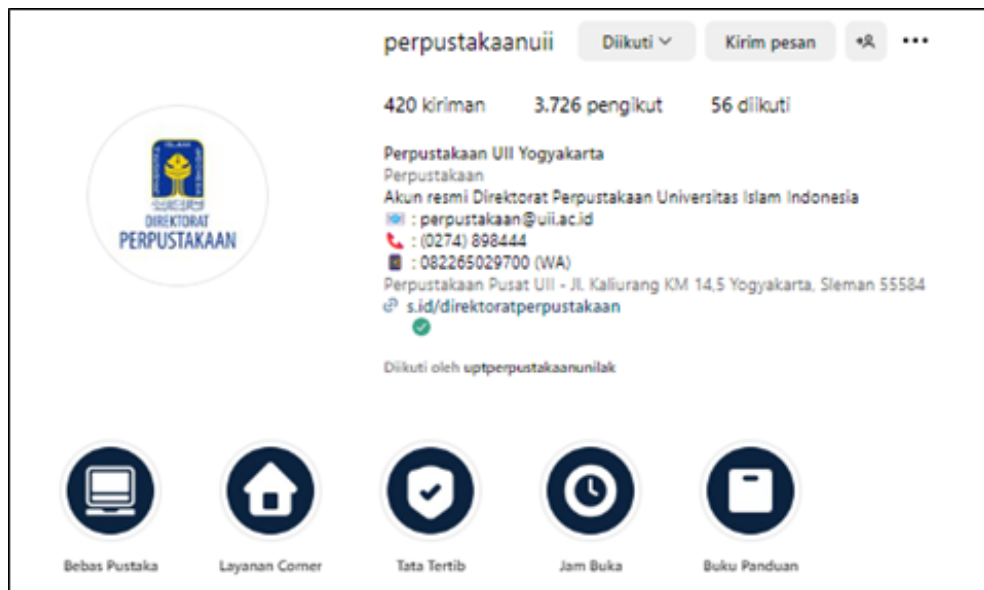
Gambar 2. Akun @perpustakaanuii

Objek penelitian ini adalah akun Instagram resmi Perpustakaan Universitas Lancang Kuning (@uptperpustakaanunilak) dan Perpustakaan Universitas Islam Indonesia (@perpustakaanuii), sebagaimana ditampilkan pada Gambar 1 dan Gambar 2. Kedua akun dipilih karena secara aktif digunakan sebagai media komunikasi dan promosi institusi oleh masing-masing perpustakaan.